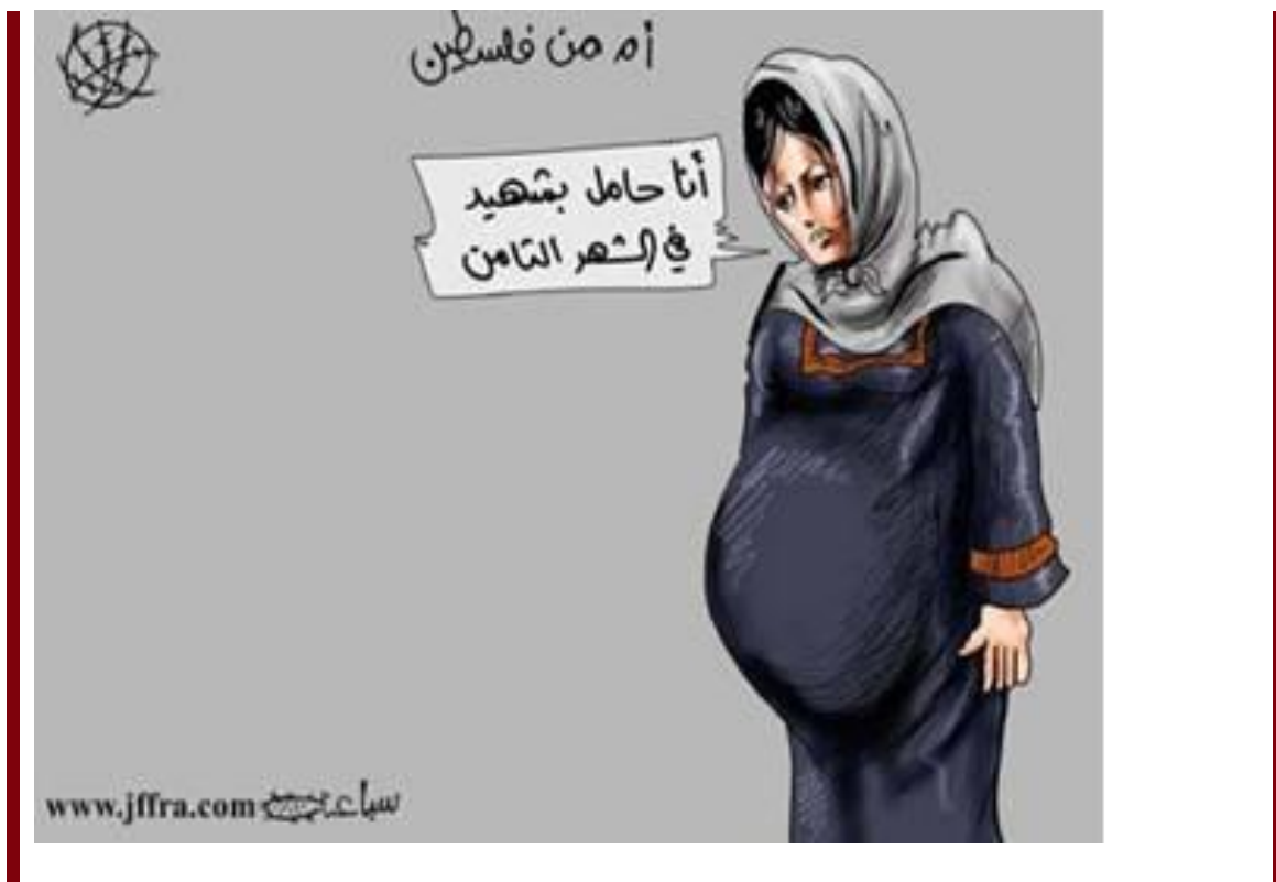
Cartoonist: Muhammad Saba'ana

Cartoon In PA Daily: Pregnant Palestinian Woman: 'I'm In My Eighth Month With A Shahid [Martyr]'